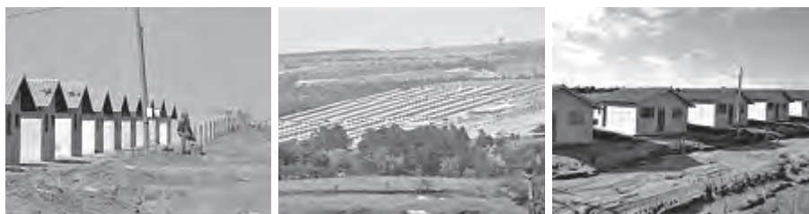
Figuras 1, 2, 3 – Projeto arquitetônico das casas recomendado pela Caixa.