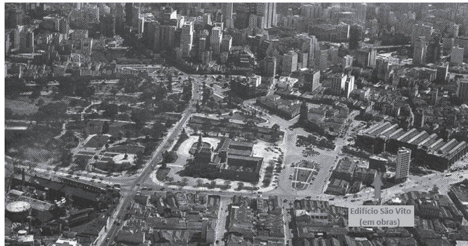
Figura 2: Vista aérea do Parque D. Pedro II em 1954 – Edifício São Vito em construção

Fonte: Foto de Henri Ballot. BURGOS, Fábio. Projeto do Improviso? São Paulo: Grupo de discussão do curso de arquitetura e urbanismo da universidade São Judas Tadeu. Disponível em: http://www.saojudasnu.blogger.com.br/2005_01_01_archive.html . Acesso em: 10 out. 2009.