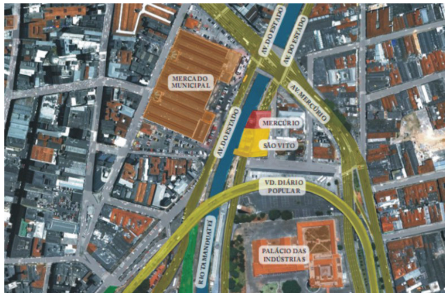
Figura 1: Inserção urbana do edifício São Vito