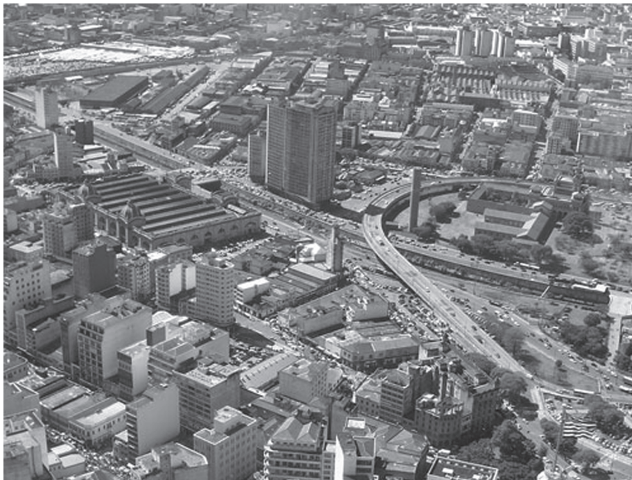
Figura 3: Edifício São Vito e seu entorno nos anos 2000