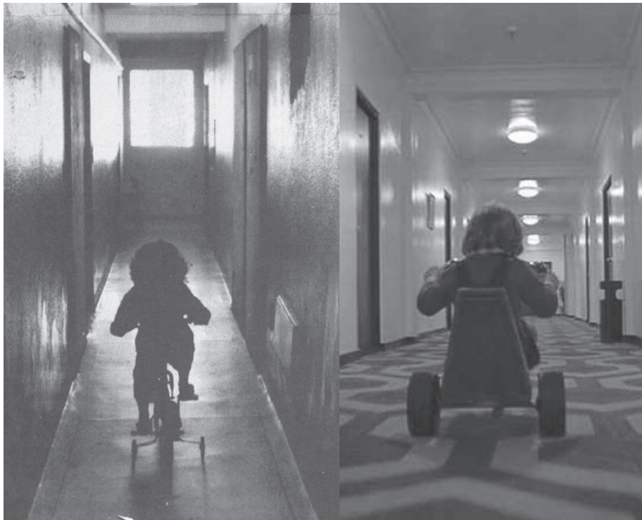
Figura 7: O medo do São Vito construído por múltiplas estratégias

Fonte: Organizado pela autora. À esquerda, cena do interior do edifício, em reportagem intitulada “São Vito vive dias de edifício fantasma” (FSP, 03/05/2004, p.C1). À direita, cena do filme de terror O Iluminado , de Stanley Kubrick (1980).