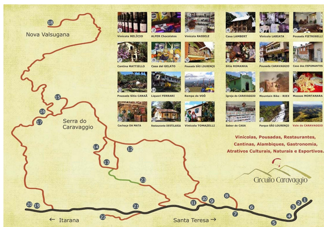
Figura 1. Secção do mapa do Circuito Caravaggio.

O Circuito Caravaggio será analisado tal como nos experimentos, em que a teoria é aplicada em um objeto concreto. Nele, procura-se observar o processo de museificação territorial por meio de ações transformadoras do circuito em território-museu. Para isso, são postas em análise as oito hipóteses explicativas da museificação mencionadas anteriormente. A intenção é reconhecer a existência de diversificação das ocorrências do fenômeno e suas expressões tangíveis e intangíveis.