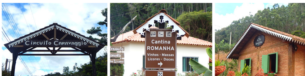
Figura 2. Uso de lambrequins em elementos do Circuito Caravaggio.