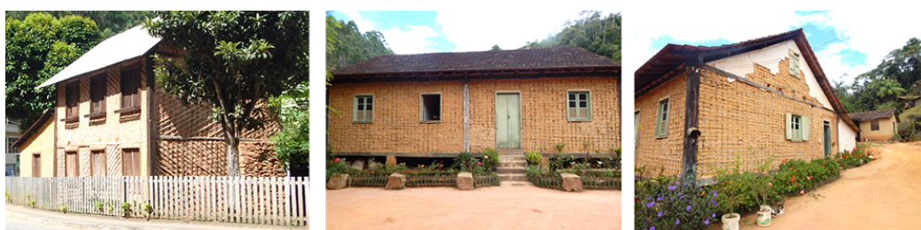
Figura 3. Casa Lambert e Sítio Romanha (duas últimas imagens).

Essa funcionalização se apresenta, por exemplo, com a remoção ou a substituição do revestimento de fachadas com o intuito de expor a vedação em taipa – técnica construtiva comum em edificações, encontrada na Casa Lambert, construção emblemática do Circuito Caravaggio. Essa edificação é um ícone da imigração no Espírito Santo, protegida como bem patrimonial material por tombamento, em 1985, no Conselho Estadual de Cultura. Entretanto, como pontuado por Posenato (1997), a arquitetura dos imigrantes é constituída de cinco fases, a saber, construções provisórias, primitivo, apogeu, tardio e atual. A edificação em foco é considerada um exemplar da segunda fase. Desse modo, Santa Teresa abriga edifícios das quatro variações em seu território, inclusive no próprio circuito, e não apenas as construídas na fase primitiva.