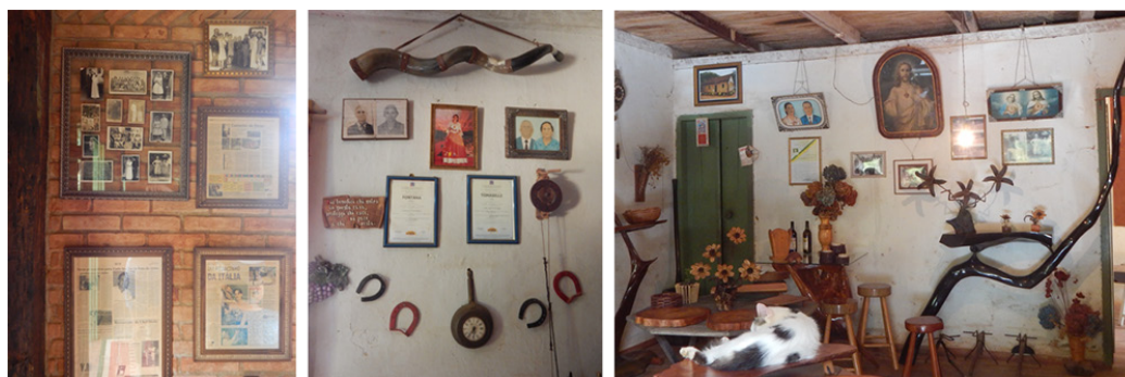
Figura 5. Exposição de elementos para comprovação de ascendência.

Uma demonstração da maneira como essas famílias interagem com o passado é a exposição, nas paredes, de fotografias e documentos antigos, bem como da comprovação de que seus antepassados foram de fato imigrantes. Elas se dirigem a esses materiais como peças que, associadas, totalizariam a cultura remanescente, como peças de museu expostas ao público (Figura 5).