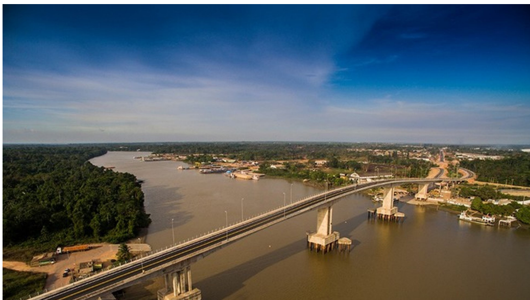
Figura 2. Ponte sobre o rio Matapi